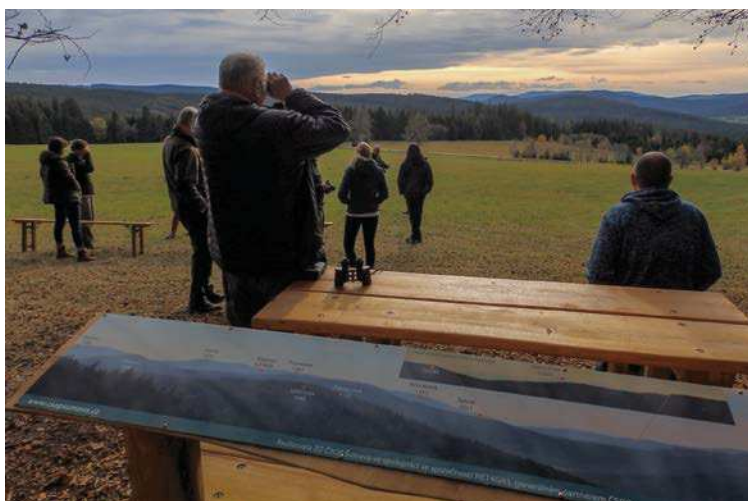
▲ Tak co, jsou vidět Alpy?

Ty alpské vrcholky, které za dobré viditelnosti vykukují nad hlavním