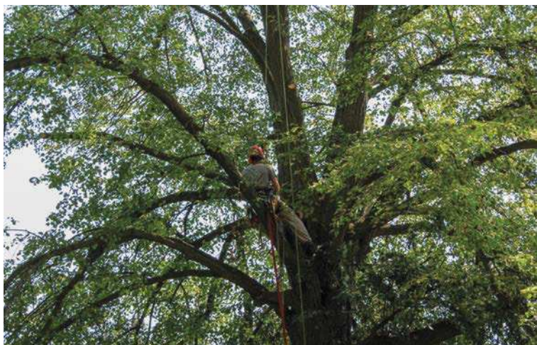
Arboristické ošetření lípové aleje u Bohumilic.

již čistě managementový. Ošetření se dočkalo dalších 42 lip, zároveň byla celá alej vyčištěna od náletových dřevin a dosazeno dvanáct nových stromků, aby měla alej kontinuitu i do budoucnosti. Částečně díky dalšímu projektu Blíž přírodě, tentokrát čistě managementovému, částečně ze státního Programu péče o krajinu.