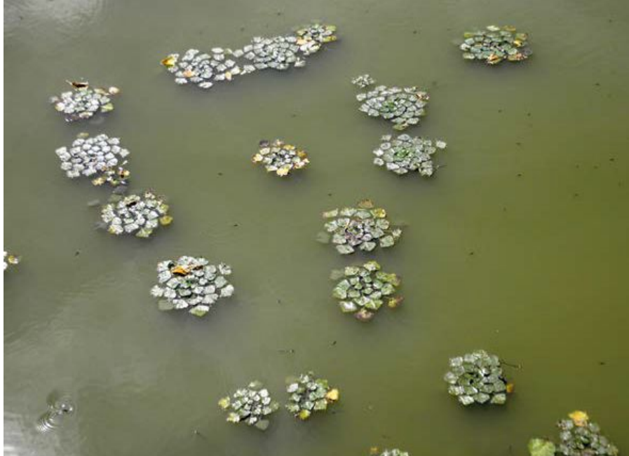
▲ Kriticky ohrožená kotvice plovoucí. ▼

Přírodní rezervace Štěpán byla vyhlášena roku 1994 a o část na území Ostravy rozšířena o rok později; dnes má výměru něco málo přes 45 ha. Kromě vlastního rybníka a již zmiňovaných podmáčených luk za železniční tratí zahrnuje i tůň zvanou Bezedný pod rybníční hrází a okolní olšiny. S tím, co zde roste a žije, a trochu také se širšími souvislostmi, vás seznámí naučná stezka. Vybudovaná byla základní organizací Českého svazu ochránců přírody Onyx v rámci programu NET4GAS Blíž přírodě v roce 2009, a jelikož již značně podlehla zubu času a rukám vandalů, byla v loňském roce díky stejnému finančnímu zdroji kompletně obnovena (přičemž se trochu změnila grafika i obsah některých informačních tabulí). Zastavení je deset. Dvě jsou dnes věnována obecnější problematice (ochrana přírody v Ostravě a okolí; člověk, krajina a ochrana přírody), jedna základním informacím o přírodní rezervaci a na zbývajících najdeme vždy po osmi druzích typických pro Štěpána a jeho okolí – druhy žijící v kulturní krajině, květiny, stromy, bezobratlé, obojživelníky a dvakrát ptáky. Většinu zastavení stezky najdeme podél modře značené turistické trasy (a cyklotrasy), vedoucí po hrázi rybníka, pár jich je