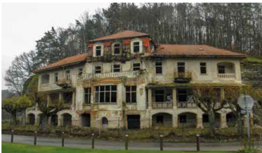
▲ Hotel Harasov dlouhé roky chátral, ale nyní se snad znovu pomalu probouzí k životu ▼ Jedna ze skalních dutin pod harasovským hrádkem

Čeká nás poslední stovka metrů – druhý nejkrásnější úsek trasy. O zajímavých skalách už bylo psáno. Ukrývají však i mnoho stop lidské činnosti. O některých se ví, jak a proč zde vznikly (dva čínské symboly zde